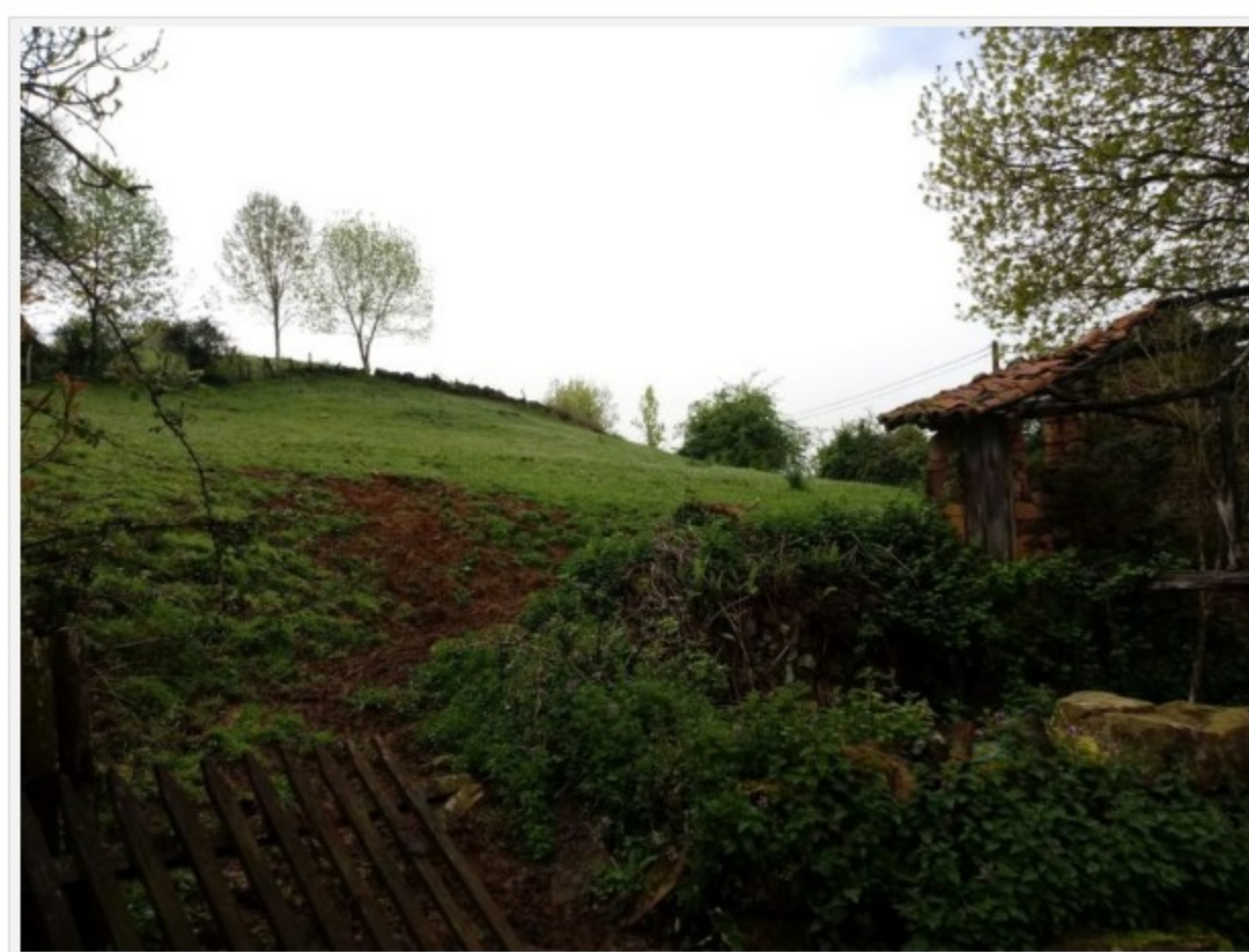
Zona en la que se construirá el complejo turístico

Linares es un pequeño pueblo situado a una altitud superior a los 700 metros. En la actualidad apenas habitan de continuo cinco familias, aunque los fines de semana y en vacaciones el pueblo se llena de vecinos que tienen allí casa y residen en la ciudad. Está situado en la sierra noroccidental del concejo, muy cerca de La Cruz de Linares, un impresionante mirador de montaña con vistas. Se puede acceder desde San Andrés de Trubia por Castañero o por la carretera de Sograndio desde Proaza.